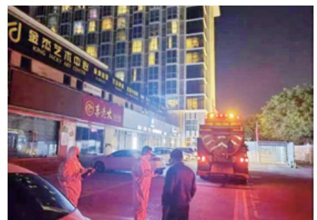
管网公司凌晨作业