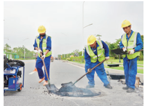
回填沥青作业

排水井盖像镶嵌在城市道路上的一颗颗“螺丝钉”，尽管微小，却不可或缺，其直接关系到道路通行安全和群众出行脚底安全。接下来，管网公司将持续把学习成效运用于为人民服务的生动实践中，把“亲民、便民、利民、护民”措施落到实处，消除道路排水井盖安全隐患，提高车辆行驶舒适度，减少噪音污染，为市民提供良好的出行条件，努力提升人民群众的获得感、幸福感、安全感。