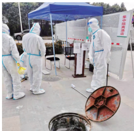
排查高栏港阿朵酒店排水情况