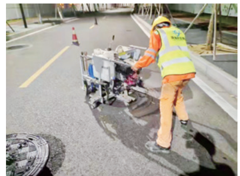
检查井切割作业