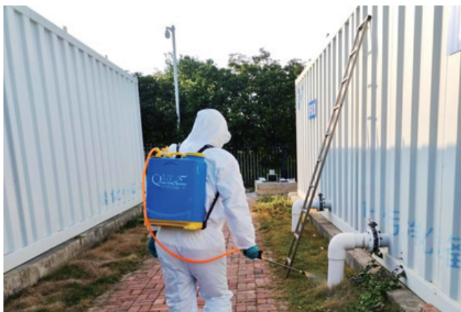
一体化处理设施加药消毒

南屏管控区内产生的污水流进水控集团前山水质净化厂处理。为有效消杀病毒，杜绝粪口传播风险，排水公司在确保出水指标达标的前提下，强化出水消毒，达到出厂水中粪大肠菌群数<500个/L，并做好监测工作，对病毒暴露及解除风险点进行防控，在污水采样、样品检测等易被感染环节做好防护。暂停用中水对绿化灌溉及道路冲洗。