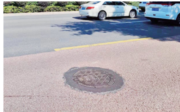
人民西路井盖更换后