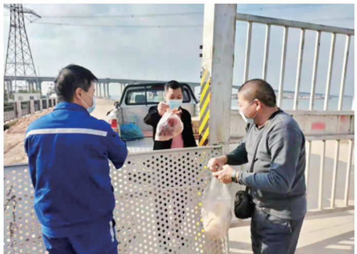
▲ 属地政府、南湾水源管理所接力做好后勤保障