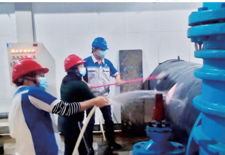
▲ 驻守人员在值班之余做足防疫、安全措施，图为打扫泵房卫生

虽然因为疫情暂时与家人分离，但亲情是隔离不开的。忙完工作，大家都会通过电话、微信等跟家人联络。我每天晚上也会跟我家上幼儿园的儿子视频聊天一会，他每天会问我在站里做了什么，然后说自己在家都做了什么事情，时不时地自夸多乖多听话的。在站里我听到最多的不是怨言，是笑声，有值班室集思广益解决难题后的笑声，有一起走路去华发水岸做核酸检测的笑声，有大伙在泵房搞卫生时的笑声。我们坚信疫情会很快过去，我们的生活也能很快恢复正常，我们更坚信我们一定能“站好这班岗”，完成疫情期间的供水保障任务！