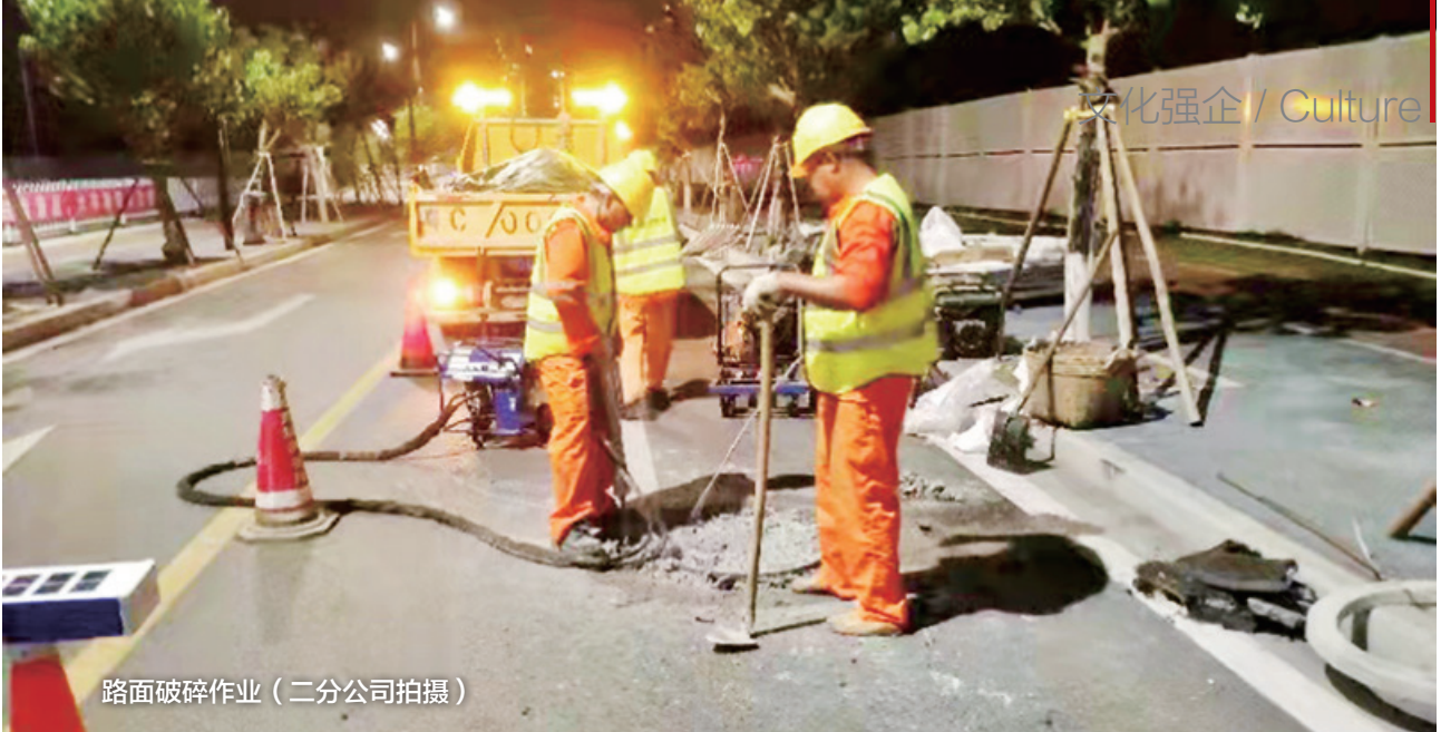
路面破碎作业

2021年9月8日，管网公司召开2021年度排水井盖专项维修工作会议暨施工安全交底会议，要求施工单位组织施工时要因地制宜、实事求是，属地各分公司要与辖区各相关部门积极沟通协调，在确保工程质量、做好安全措施的前提下抢抓进度，把这项民生工程办好办实，真正实现民生实事落地暖心。